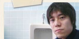
▲静かに意気込む様 (プラフメンバーが私しかいないので自撮り)