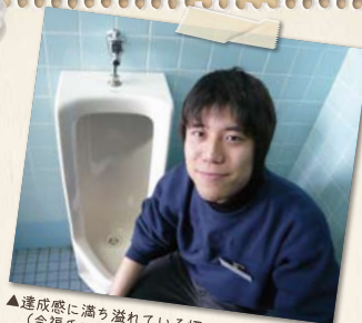
▲達成感に満ち溢れている様